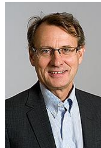
Anders Sundström VD Folksam 2004 - 2013